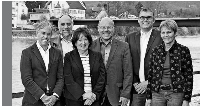
Vorstand der grenzüberschreitenden Kulturnacht.

In Zusammenarbeit mit dem Kernkraftwerk Leibstadt sucht der Verein Kulturnacht Bilder, Zeichnungen, Fotografien und Skulpturen, die das Thema «Energie» auf originelle, kreative und überraschende Art abbilden. Teilnahmeberechtigt sind Schulen, Privatpersonen, Firmen und Künstler. Die Prämierung findet