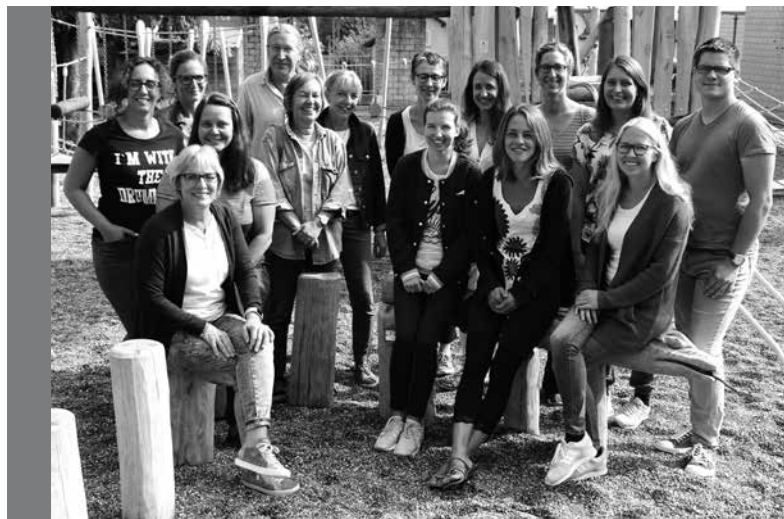
Das Lehrerteam der Kreisprimarschule Chrüzlibach

Der Elternmorgen im Oktober, der gemeinsame Liechtliumzug in Rekingen im November, der Weihnachtsanlass im Dezember und die Schulschlussfeier im Juli sind noch nicht vergessen. Alle diese Anlässe sind gelungen, obwohl vorher nie so viele Eltern und Kids an Schulanlässen teilgenommen haben. Weitere Höhepunkte in einem abwechslungsreichen Schuljahr waren das gemeinsame Klassenlager aller MittelstüfelerInnen in Vordemwald, das Schneesportlager in Davos, die Themenwoche, die Buchstabetage, Bau und Einweihung des genialen neuen Spielplatzes, die ersten Erfahrungen mit einer «Bläserklasse». Und ein ganz besonderer Anlass war die schulinterne Verabschiedung scheidender Lehrpersonen, da war zu sehen, zu hören und zu spüren, dass in wenigen Monaten eine Schulgemeinschaft entstanden ist mit einem beeindruckenden und bewegenden Zusammengehörigkeitsgefühl.